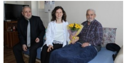
"Yaşlılara Saygı Haftası"