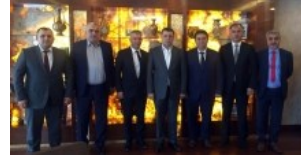
TÜRK METAL'A ZİYARET