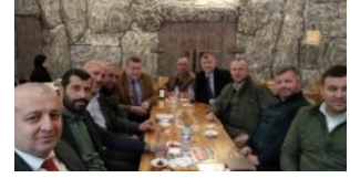
TSO EKİBİ ZİYARETLERDE