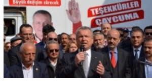
'İKİNCİ ATILIM DÖNEMİ'