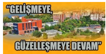
"ÜNİVERSİTE DAHA DA BÜYÜYECEK"