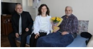
"Yaşlılara Saygı Haftası"