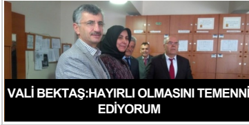
VALİ BEKTAŞ: HAYIRLI OLMASINI TEMENNİ EDİYORUM