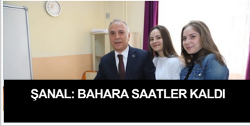
ŞANAL: BAHARA SAATLER KALDI