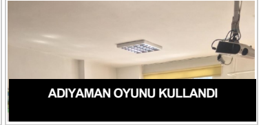
ADIYAMAN OYUNU KULLANDI